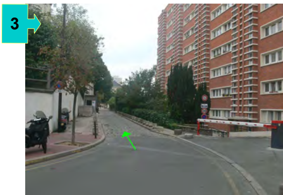
3 → La rue du Séminaire de Conflans se poursuit en impasse pavée