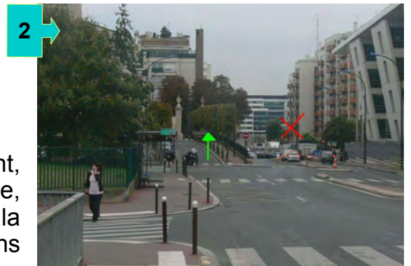
Après le pont, à la fourche, prendre à gauche la rue du séminaire de Conflans